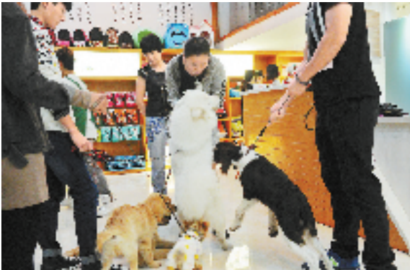
每到傍晚,主人们牵着宠物狗来到平阳“悦宠会”里“赶集”。

随着人们生活水平的提高,宠物产业实实在在成为一块大蛋糕。眼下,浙江锦恒控股集团拟投资5亿元建设以宠物时尚为主题的“亚洲宠物体验中心”;平阳源飞宠物企业拟投资5亿元在南雁闹村,建设中国鸚鵡玩赏城。如此看来,平阳打造宠物产业方兴未艾,前景远大。