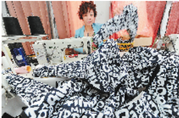
平阳金果果宠物用品有限公司车间,员工在包装宠物斜挎包。