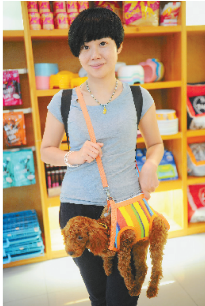
“悦宠会”上,这位女孩花了60元买了一个宠物多功能包。怎么样?够萌吧?