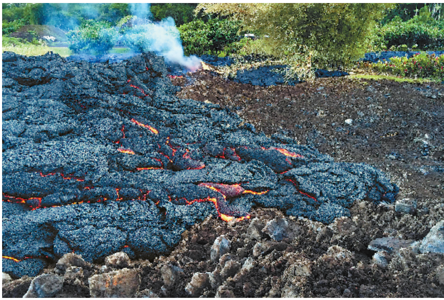
美国地质勘探局提供的这张照片显示的是夏威夷基拉韦厄火山喷发出的岩浆(10月30日摄)。