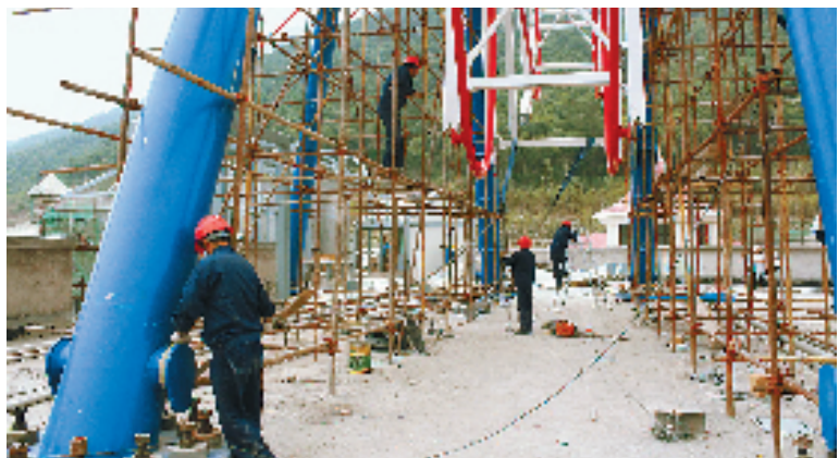
浙江大型游乐项目——位于安吉的Hello Kitty乐园,大多数设备安装已完成八成以上。正在施工中的滑道摩天轮高约40米,直径约30米。