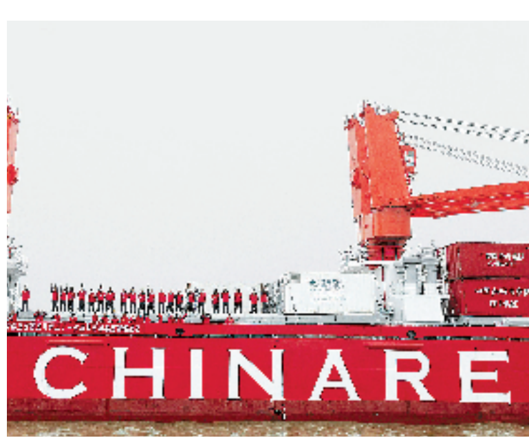
10月30日,“雪龙”号从位于上海浦东的中国极地考察国内基地码头启航,开始执行我国第31次南极科学考察任务。据悉,中国第31次南极科学考察队共有281人,“雪龙”号将执行“一船三站”(中山站、泰山站、昆仑站)任务。考察队从上海出征后,经由澳大利亚霍巴特到达中山站,再经南极罗斯海,到达新西兰克雷斯托彻奇补给站,二次返回中山站,完成预定任务后,经由澳大利亚弗里曼特尔回国,总航程约3万海里,历时163天。