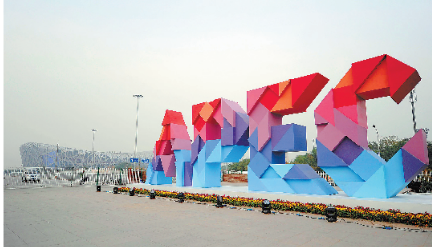
2014年11月5日至11日,亚太经济合作组织(APEC)领导人会议周各项活动将在北京举行。图为“APEC”标志亮相北京奥林匹克公园(10月29日摄)。

此外,APEC领导人与工商咨询理事会(ABAC)代表对话会将于11月10日下午举行。