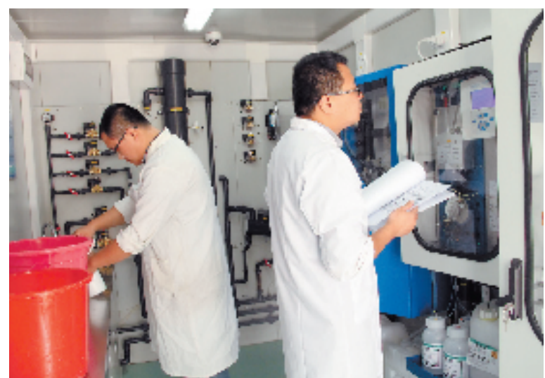
近日,全省首个微型水质在线监测站在常山县南门溪投入试运行。该站具备采水、配水、自动分析、数据采集发送、管路清理等常规水站的所有功能,能对水中高锰酸盐指数、氨氮、总磷三个污染因子实行全天候无人值守自动监测。图为该县环保局技术员查看试运行情况。

截至目前,嘉善县共办理涉及三权抵押贷款80单,县农商行、农行、村镇银行、邮储银行4家涉农银行全部加入,累计发放贷款总量达到12742.7万元,通过试点初步形成改革链条框架和制度体系。下一步,嘉善县将计划在试点基础上全面推行这项改革,让改革红利惠及更多农民群众。