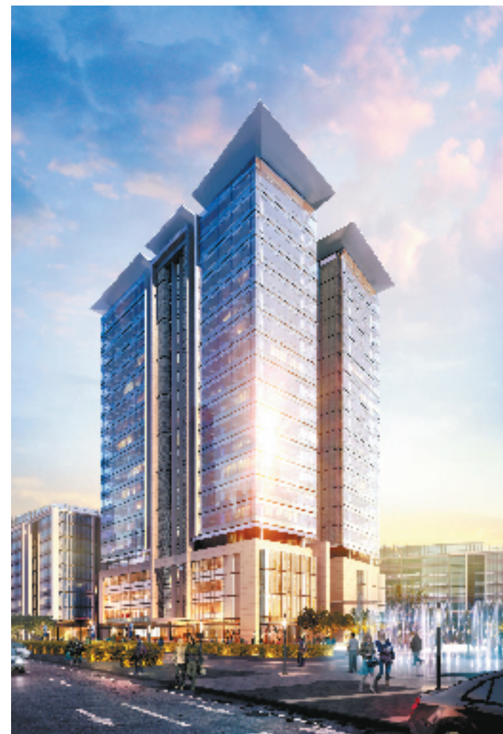
产业创新高层建筑效果图

“这既可能是大企业一统江湖的机遇,也可能是小企业厚积薄发的机会。取决于,谁掌握先机,把握互联网脉搏。” ——富春硅谷创智讲堂第二讲和君咨询刘海峰