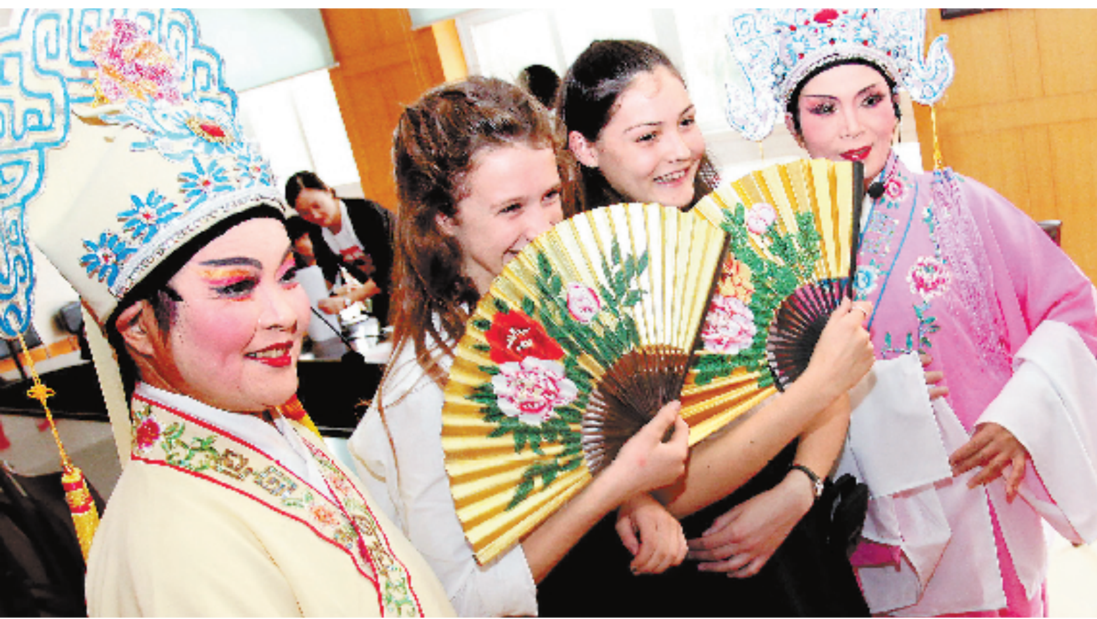
10月29日,在宁波效实中学国际中心就读的英国伍德豪斯中学的13名学生,由老师带领走进海曙区万安社区,了解宁波民俗,领略了中医药、京剧、越剧、太极拳等中国传统文化,加深了洋学生对祖国灿烂文化的了解。

“新高考”政策实施后,“3+X(文科综合或理科综合)”套餐模式将变成“3+3”自助餐模式,不再分文理。考试科目分必考科目和选考科目,必考科目为语文、数学和外语,选考科目由考生在思想政治、历史、地理、物理、化学、生物、技术(含通用技术和信息技术)等7门高中选考科目中自主选择3门。根据方案,高考总成绩满分为750分,其中语数外每门满分150分,按得分计入。选考科目按等级赋分,每门满分100分,以高中高考成绩合格为赋分前提,根据事先公布的比例确定等级,每个等级分差为3分,起点赋分40分。