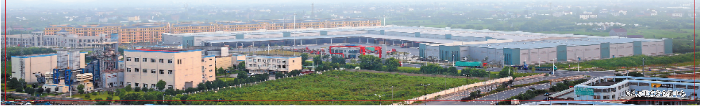
6.4万平方米仓储中心

目一期投资2.2亿元,目前15条绝缘型钢电表箱生产线已安装完毕正在调试,即将正式投产。总投资3亿元、注册资本1亿元的芯亿微电子科技有限公司已在小批量生产,达产后年产量20亿颗以上。此外,诺英五金、捷明机械等一批新项目也已竣工投产。