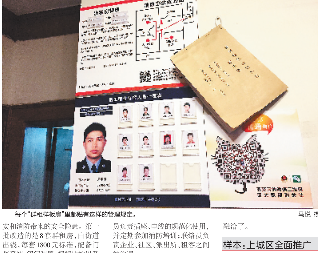
每个“群租样板房”里都贴有这样的管理规定。

今年4月,湖滨街道以涌金门社区为试点,探索群租房标准化改造,以期降低群租行为给治