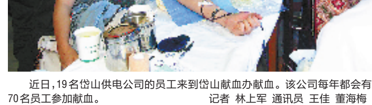
近日,19名岱山供电公司的员工来到岱山献血办献血。该公司每年都会有近70名员工参加献血。

诸暨市为缓解农村土地指标“僧多粥少”的矛盾局面,创新推出农村建房指标摇号产生,有摇号资格的对象只能是无房产、危房户、受灾户、困难户等住房困难群众。