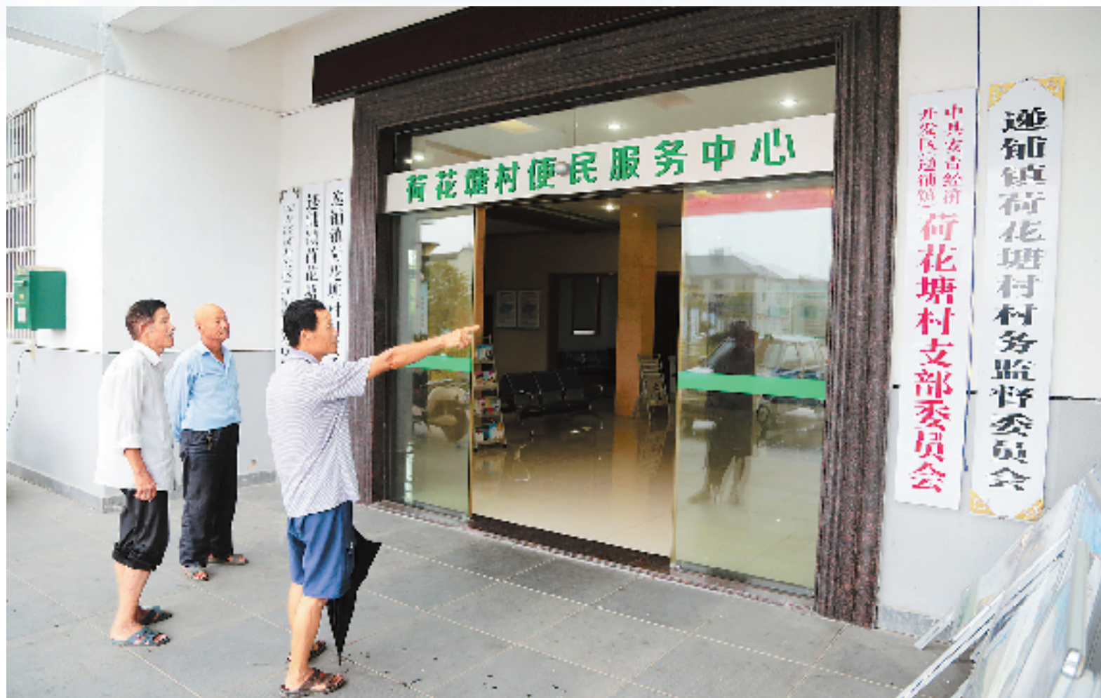
牌子少了,村办公楼前焕然一新。

村和社区作为与群众接触最密切的组织,如何创新社会治理,提升治理水平,增强发展活力?针对牌子多、台账多、考核多等问题,从2012年起,安吉推行村级事务准入制,从精减牌子、清理台账、优化检查考核入手,减轻基层负担,激发基层组织活力,更好地服务群众。