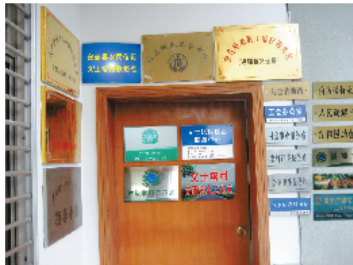
清理前,牌子多得没地方挂。

为此,安吉制定《村级事务准入运行规范》,明确准入事务的程序和标准,对审核准入的村级事务,涉及标识标牌的,统一规范模