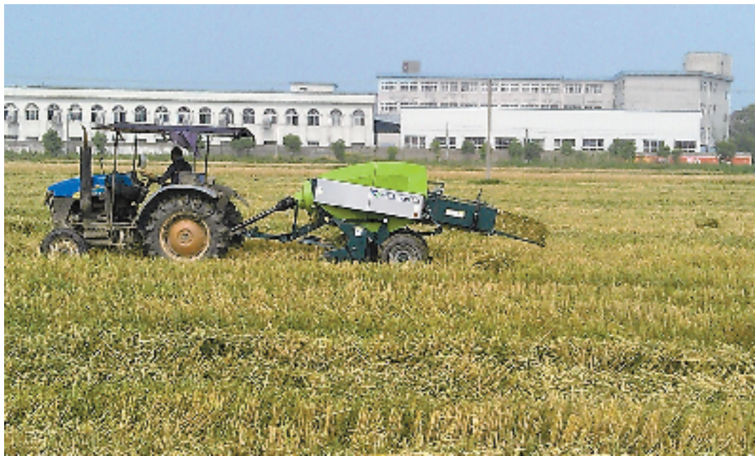
对秸秆进行机械捆扎。

今年我省有粮食作物种植的30个市辖区将禁止焚烧秸秆,秸秆去哪儿?生物质能源化的发展与运用被视作一个大方向。目前,我省已有47个农林生物质能源化生产企业,年利用生物质原