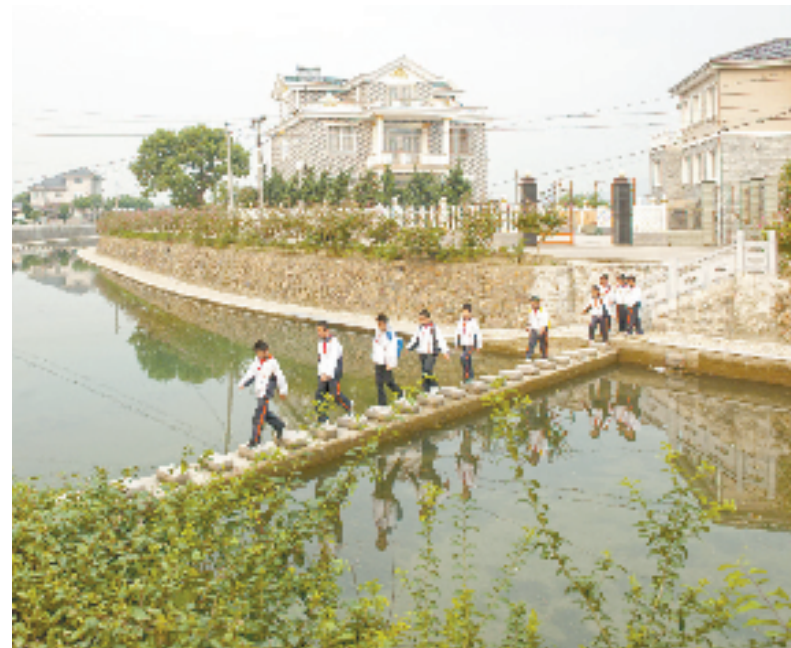
穿过北仑头村的小溪