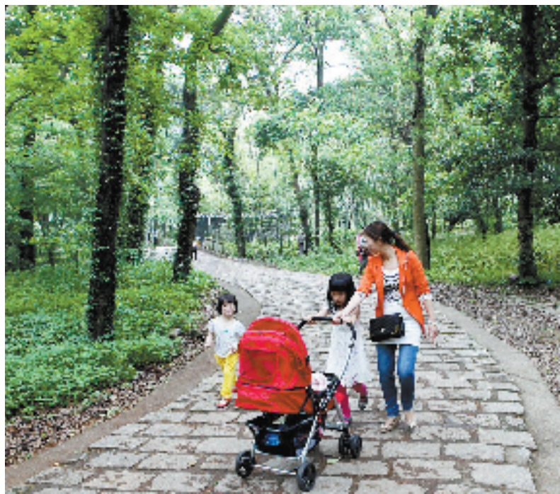
森林步道让市民亲近自然

“以港兴城,以城兴港”,今天,人们欣喜地看到,一个承载着宁波工业强市之梦的新经济重心,在杭州湾南岸、东海之滨的东方大港——北仑港畔迅速形成。