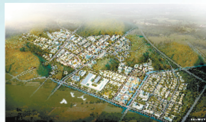
云栖小镇整体效果图