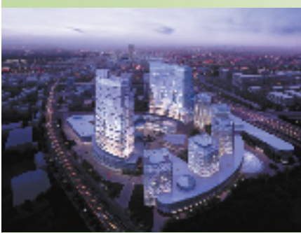
西溪谷高新技术产业带

眼下,西湖区正通过以智慧产业化和产业智慧化为重点,以云栖小镇、西溪谷、杭州云谷为主阵地,以浙江大学国家大学科技园、转塘科技经济园、西湖科技经济园(国家广告产业园)、西溪创意产业园、福地创业园和文三路电子信息街为主平台,加快形成“一镇两谷、六园一街、产城应用、多点辐射”的总体布局。