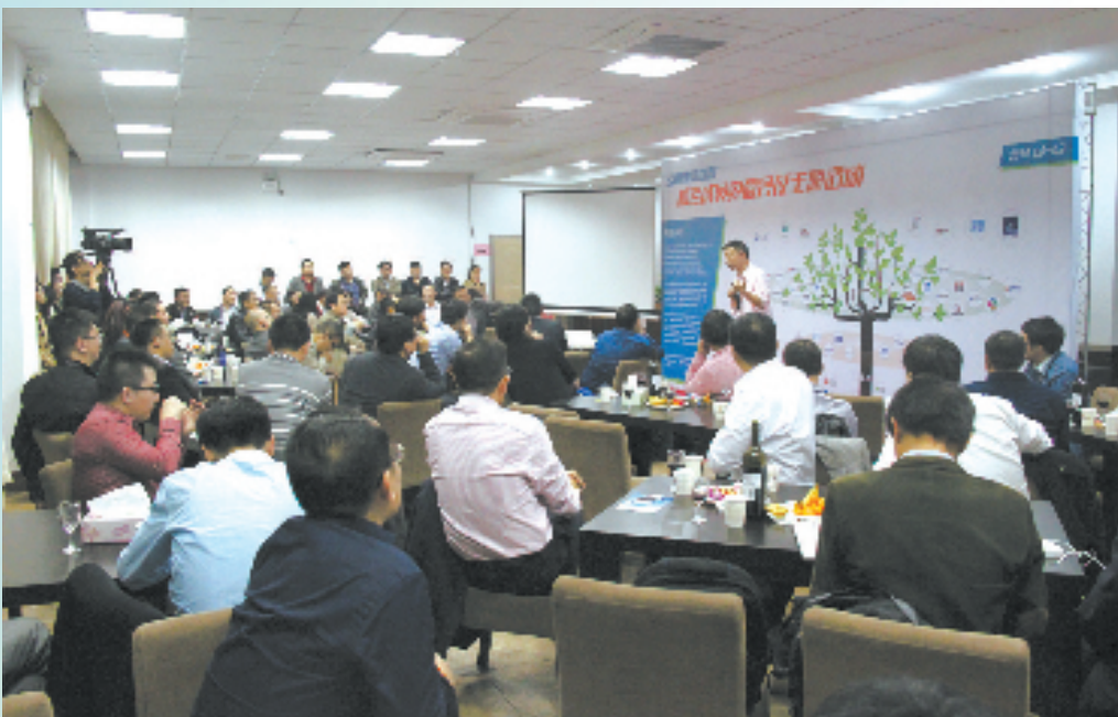
云栖小镇联盟活动

通过3至5年,集聚上千家基于云计算的创新企业,涵盖移动互联网、APP开发、游戏、互联网金融、数据挖掘等云计算应用各个领域,形成完整的云计算产业链。到那时,云栖小镇将成为创新创业的圣地,创新人才集聚的高地,科技人文的传承地,云计算大数据科技的发源地,产值超百亿元的“云谷”先行区。