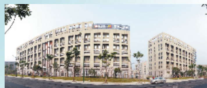
阿里云&华通云数据中心

推动文化创意产业与信息产业、智慧产业融合,大力发展数字内容产业。以之江文化创意园