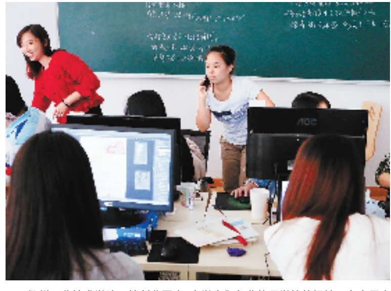
衢州职业技术学院一楼创业园内,大学生们免费使用学校的场地开办电子商务、婚纱摄影等公司。