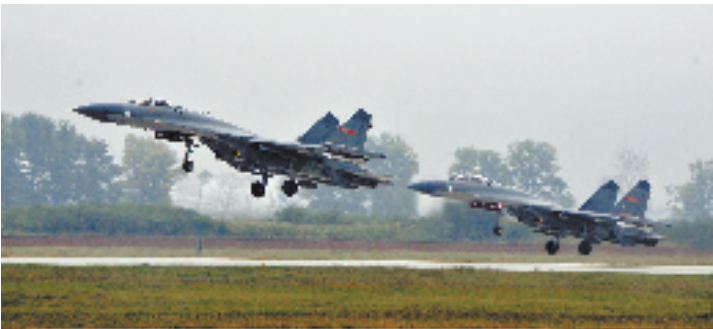
2014年8月29日,在华北某军用机场,参加“和平使命-2014”实兵演练的中国空军歼-11战机双机编队起飞。近年来,中国与世界各国组织开展了一系列联演联训活动,以开放的姿态学习借鉴外军有益经验,提升部队实战化训练水平。