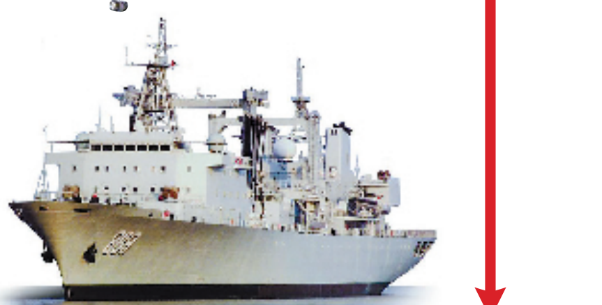
2013年6月,我国新一代大型远洋综合补给舰“太湖”舰正式入列。