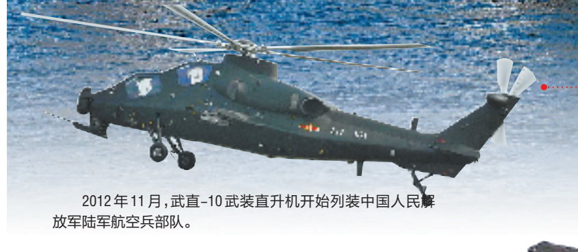
2012年11月,武直-10武装直升机开始列装中国人民解放军陆军航空兵部队。