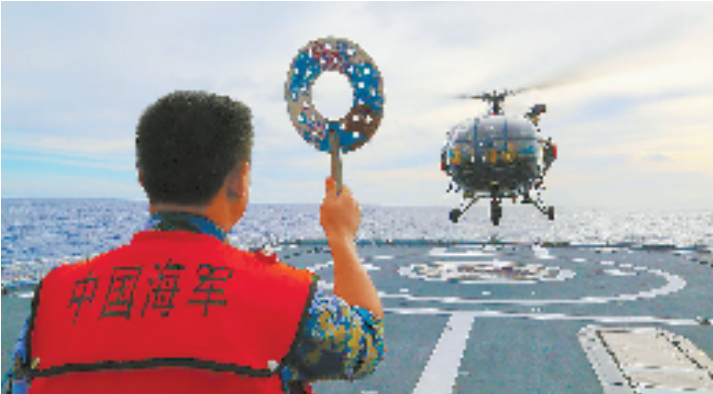
2014年7月12日,法国海军的云雀直升机,降落在参加“环太平洋-2014”演习海上演习阶段的中国海军“海口”舰直升机甲板上。自上世纪80年代开始,中国军队的开放和对外交流就一直没有停下。在辽阔的海洋上,走向深蓝已经不是梦想。