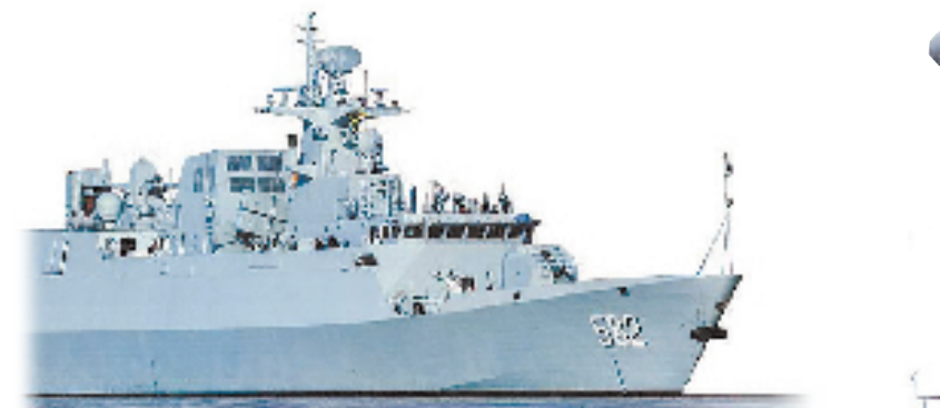
2013年3月,056型护卫舰首舰“蚌埠”舰正式交付海军。未来几年将有大约10艘该型护卫舰入列。