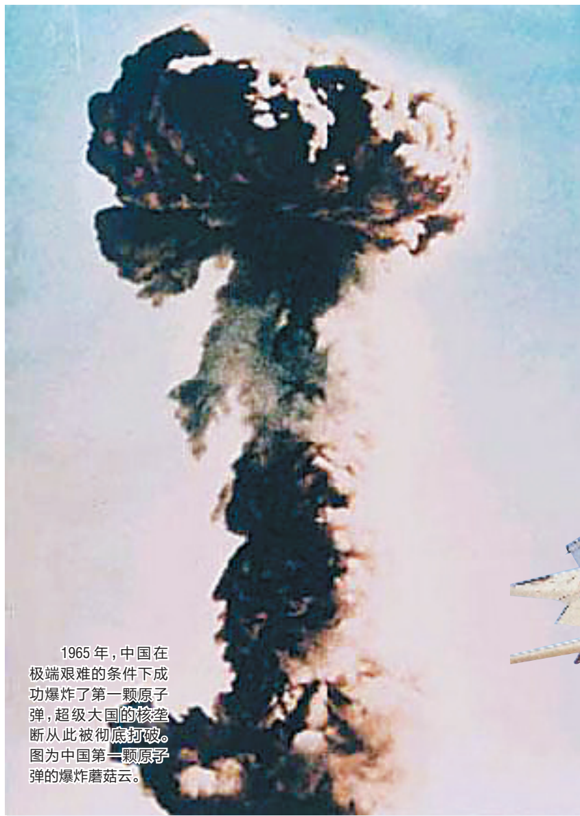
1965年,中国在极端艰难条件下成功爆炸了第一颗原子弹,超级大国的核垄断从此被彻底打破。图为中国第一颗原子弹的爆炸蘑菇云。

在未来的若干年中,在现代化装备武装下和实战化条件下磨砺的中国军队,必然会越来越底气十足。(据新华社)