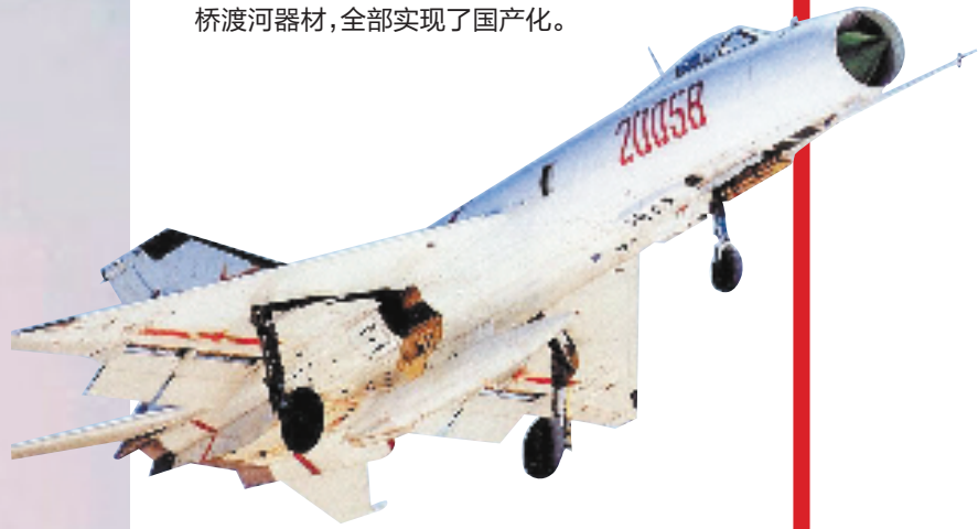
中国沈阳飞机工业集团有限公司在上个世纪60年代开始设计研制的歼-8战斗机,是中国空军和中国海军航空兵上世纪80年代至本世纪初主力战斗机种之一。

20世纪50年代中期到60年代初,中国从仿制苏式武器装备开始进行武器装备国产化。大量仿制的武器装备相继装备部队。到1975年底,全军武器装备中,国产坦克占71%,飞机占75%,战斗舰艇占89%,工程机械占96%,火炮占97%;枪械、通信、防化装备和舟桥渡河器材,全部实现了国产化。