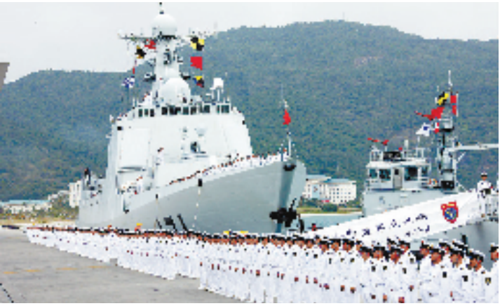
2008年12月26日,中国海军舰艇编队从海南三亚起航,赴亚丁湾、索马里海域执行护航任务。这是我国首次使用军事力量赴海外维护国家战略利益,是我军首次组织海上作战力量赴海外履行国际人道主义义务,也是我海军首次在远海保护重要运输线安全。