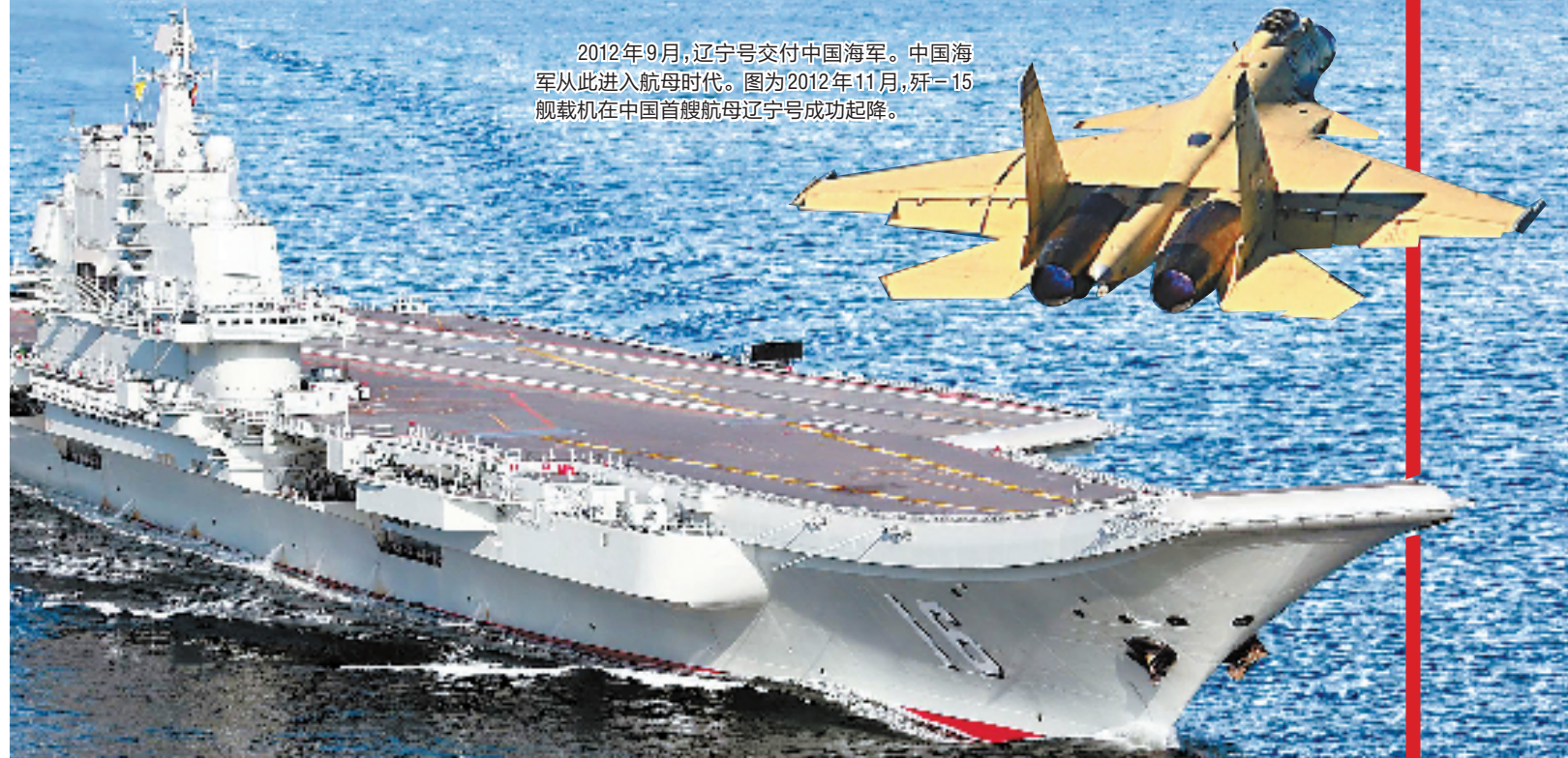
2012年9月,辽宁号交付中国海军。中国海军从此进入航母时代。图为2012年11月,歼-15舰载机在中国首艘航母辽宁号成功起降。

20世纪90年代以来,我军武器装备现代化建设,以科技强军战略思想为指导,充分发挥国防科技工业的潜力,军民一体,联合攻关,使我军武器装备又发生了质的飞跃。特别是进入新世纪以来,为应对新时期的安全挑战,中国军队正在进行历史上罕见的快速现代化。