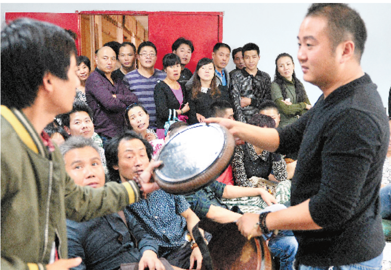
10月11日,为救助自闭症患儿,嵊州怡心公益志愿者团队举办爱心公益拍卖活动。