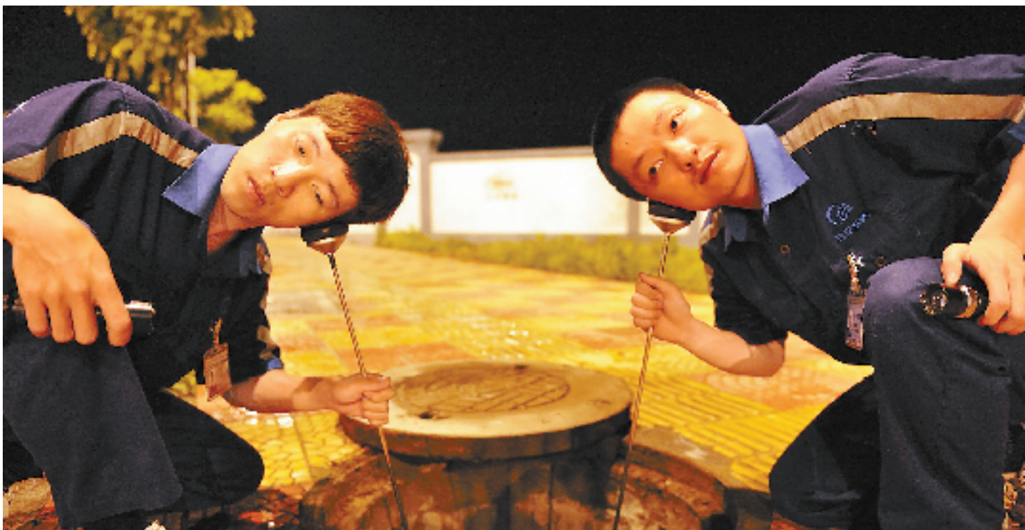
瑞安水务集团听漏工正在分辨声音。