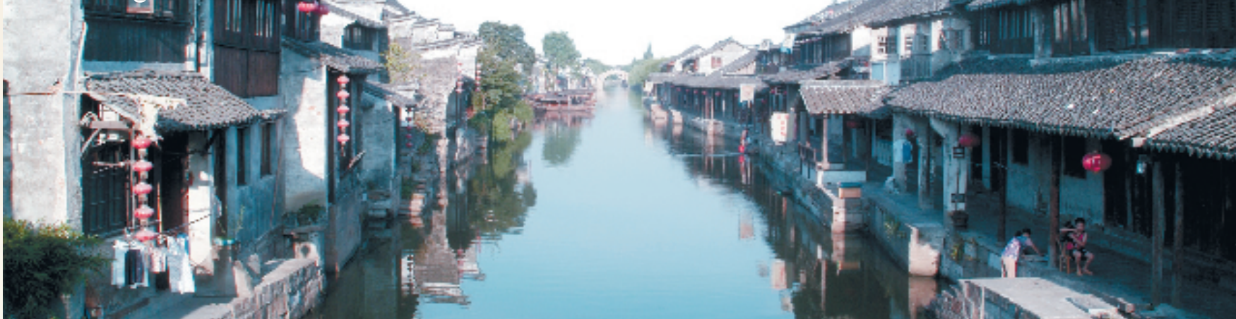
中国历史文化名镇——西塘