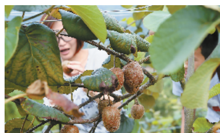
江山塘源口乡是省级现代猕猴桃生产基地所在地,全乡有果农 1299 户,种植猕猴桃 6000 亩。今年是猕猴桃大年,预计产量 5000 吨,产值 4000 万元,户均收入 3.08 万元,比去年增产 16%。

据了解,目前西班牙除了适合房地产投资以外,其金融项目,文化教育和旅游开发等领域亦充满了投资机会。