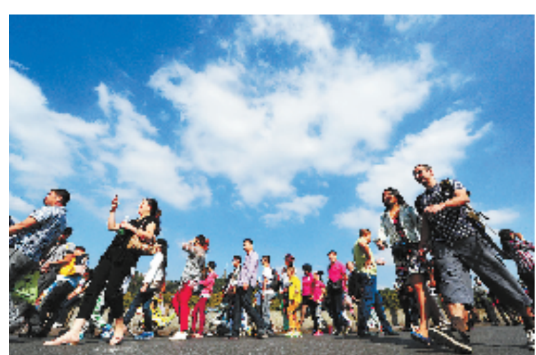
10月4日,杭城天气晴朗、秋高气爽。西湖边,游客游得欢。