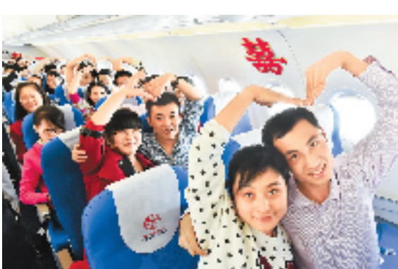
10月4日,来自同一家企业的58对新人搭乘东航MU5131杭州至北京的航班,在万米高空举行了一场别开生面的集体婚礼。

记者看到,不时有游客前来咨询道路、景点等情况,这些看上去严肃的武警官兵,每当游客走过来寻求帮助时都格外热情和耐心。