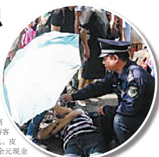
撑伞哥救助照片。