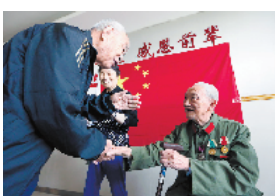
10月4日,嘉兴新安国际医院举行“我与国旗合影”活动。现场,89岁的“华东一级战斗英雄”印永鑫(右)与91岁的抗日英雄王继述激动不已。