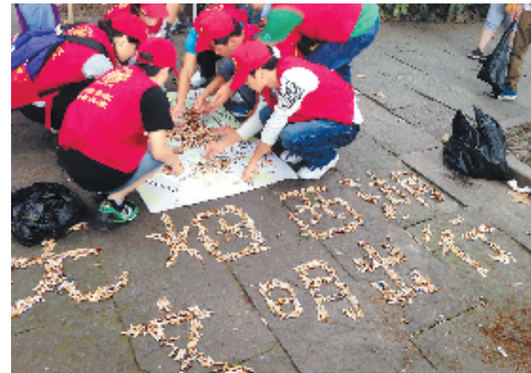
杭州电子科技大学的志愿者们用烟头拼出“无烟西湖、文明出行”字样,呼吁市民游客保护西湖,不要随意乱扔烟头和垃圾。