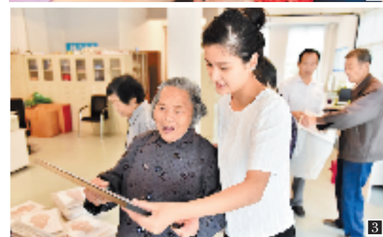
图1为萧山抗战老兵送蛋糕;图2为湖州电力员工给老人送水果;图3为杭州丁桥三义苑社区老人送照片;图4为磐安“炼火”庆重阳。