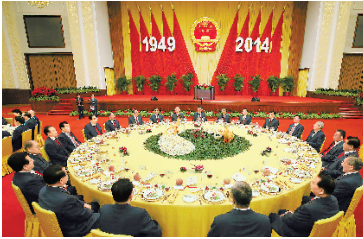
习近平、李克强、张德江、俞正声、刘云山、王岐山、张高丽等党和国家领导人与中外人士欢聚一堂,共庆佳节。

习近平强调,面向未来,我们必须坚持同人民在一起,为了人民干事创业,依靠人民干事创业,始终把实现好、维护好、发展好最广大人民根本利益作为一切工作的出发点和落脚点;我们必须坚持走自己的路,不断增强中国特色社会主义道路自信、理论自信、制度自信,使中国特色社会主义这条康庄大道越走越宽广;我们必须坚持抓好发展这个第一要务,不断开拓生产发展、生活富裕、生态良好的文明发展道路,为实