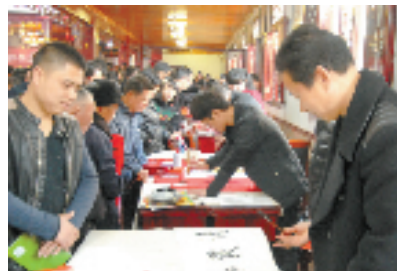
箬隆文化礼堂“迎新春、送春联”