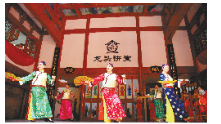
龙头文化礼堂草根文艺表演