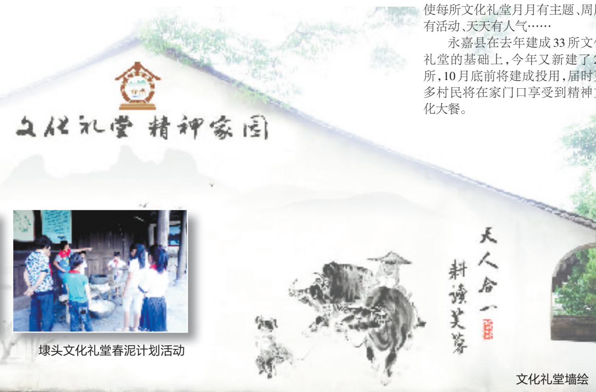
文化礼堂 精神家园

永嘉县在去年建成33所文化礼堂的基础上，今年又新建了26所，10月底前将建成投用，届时更多村民将在家门口享受到精神文化大餐。