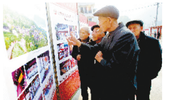
梨村文化礼堂礼仪展示现场会