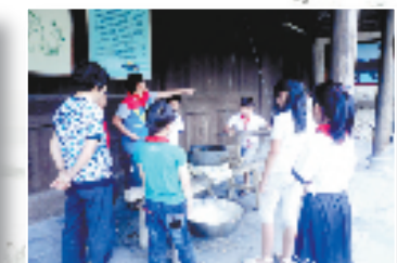
垟头文化礼堂春泥计划活动