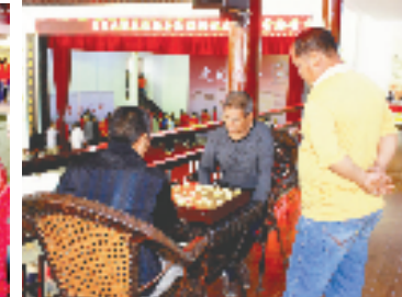
枫林文化礼堂礼事日