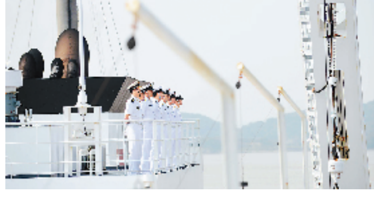
9月29日，圆满完成“环太平洋—2014”多国海上联合演习及“和谐使命—2014”人道主义医疗服务任务的中国海军和平方舟医院船返回浙江舟山某军港。

林郑月娥说，将公众咨询暂时放缓一点，对于事态发展是有利的，对于后续的工作也是有利的。