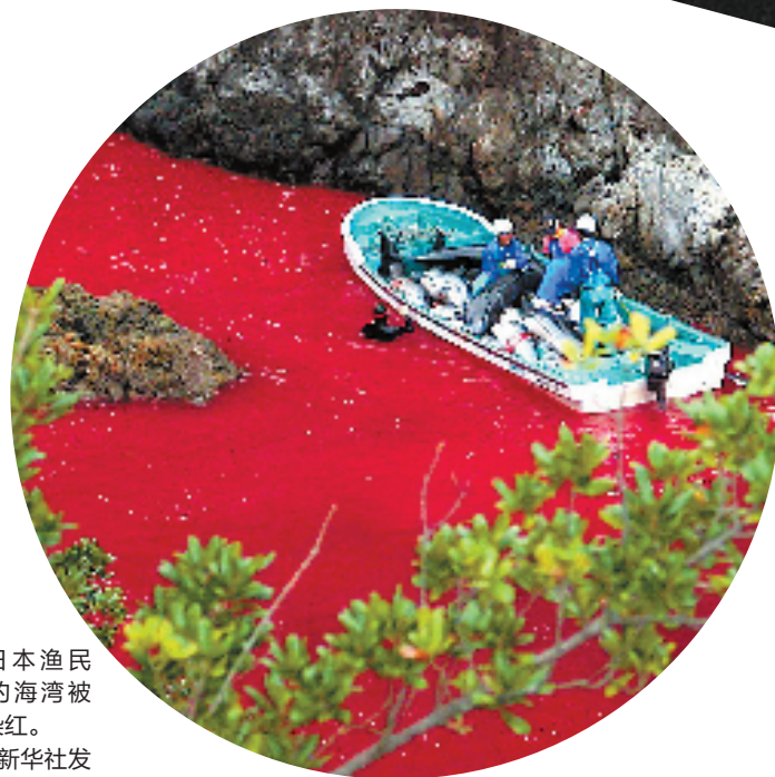
日本渔民猎鲸的海湾被鲜血染红。

报道称,国际捕鲸委员会大会15日在斯洛文尼亚南部城市波尔托罗开幕,这是今年3月国际法院命令日本停止按照现行计划实施南极海域科研捕鲸活动后,该组织首次召开大会。新西兰代表在大会上发表提案称,希望日本政府尊重国际法院的裁定,改变每年一次在科学委员会上提出“科研捕鲸”的计划,转为在每两年召开一次的总会上提交。该提案获得各国代表支持,最终以多数赞成的结果通过。共同社称,日本政府原指望通过此次大会寻求国际社会的理解,结果却令人失望。时事通讯社称,日本重启南极海域科研捕鲸的计划或将受到影响。日本《朝日新闻》今年4月在日本全国范围内进行的调查显示,反对“科研捕鲸”的日本国民仅有23%,即使在不吃鲸肉的调查对象中,反对者也仅有30%。有日本网民称,“科研捕鲸并不是坏事,禁止捕鲸是对日本饮食文化的打压”。