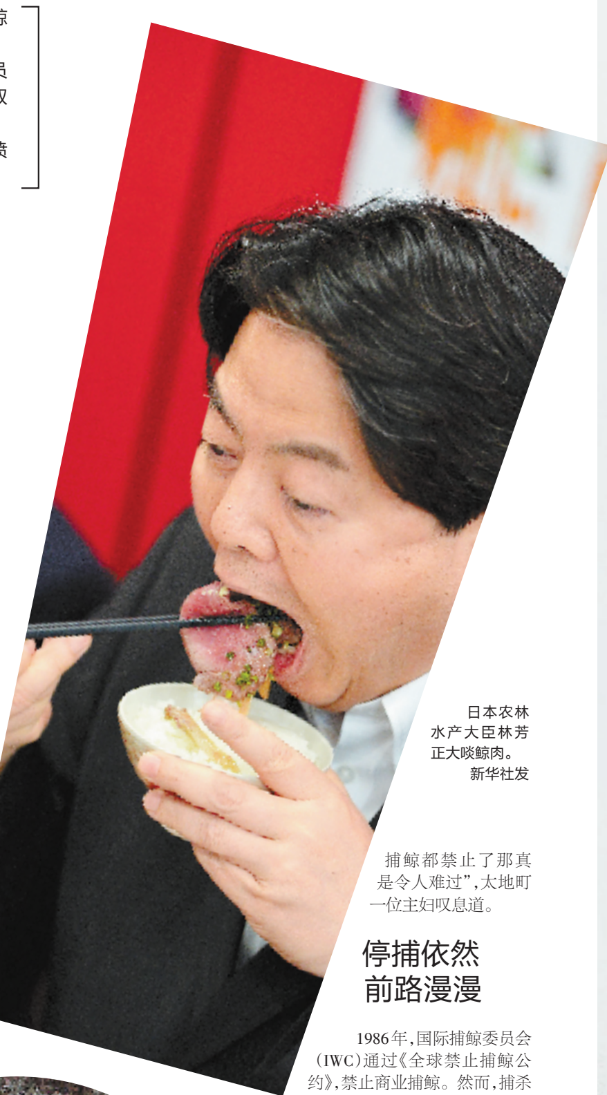
日本农林水产大臣林芳正大啖鲸肉。

如果不了解事情原委,上述讲话可能会被误认为是某位代表为捍卫其传统文化而发表的讲话。事实上,这是日本政府代表佩贾姆·阿卡