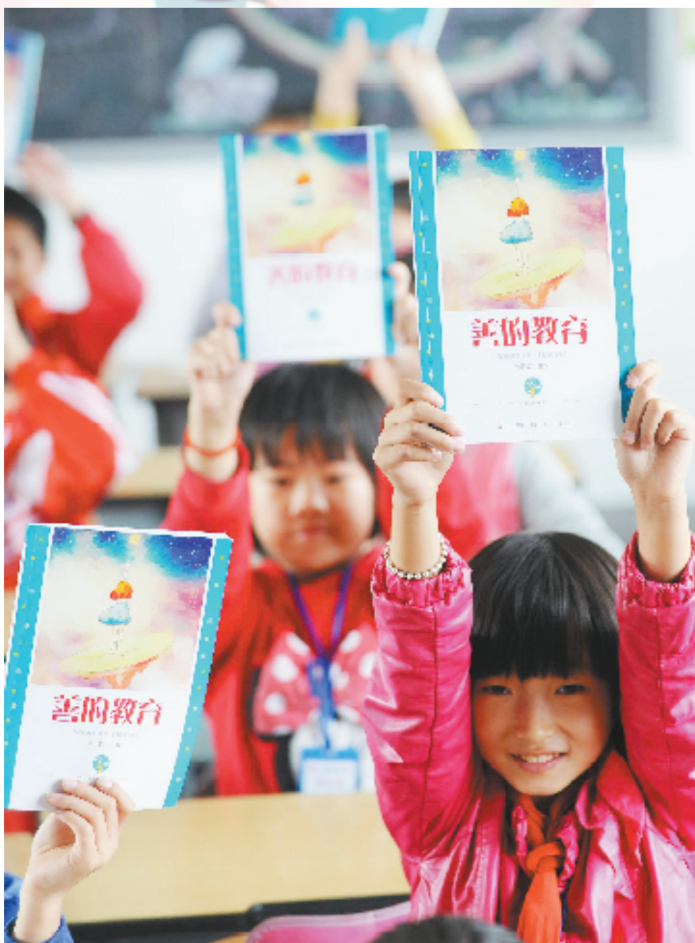
《善的教育》校本教材