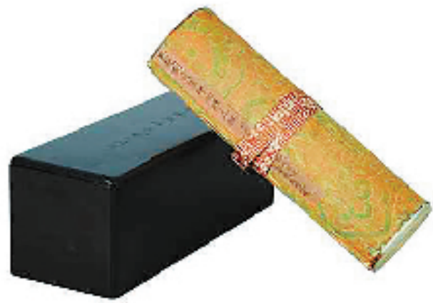
“吴越刻雷峰塔藏经”。

“而成就此经卷独一无二价值的是琳琅满目的名家题跋,及其在收藏文化史上的样本意义。”