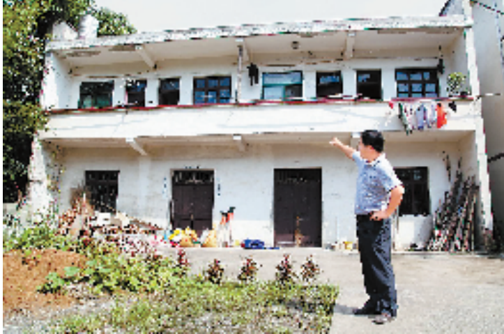
上世纪90年代建起的二层水泥楼房。