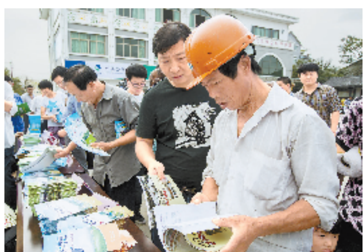
村民正在翻阅省农业厅专家送来的资料。

目前除互联网企业外,还有越来越多的金融机构和国有企业进入互联网金融行业,衍生出越来越专业的P2P平台,未来担保、融资租赁、保理、票据金融、供应链金融、证券化产品等全新互联网金融产品。相关数据表明:目前我国中小企业数量占全国企业总数的90%以上,在工业总产值和实现利税中的比重分别为60%和40%,但其在全部银行信贷资产中的使用比率不到30%,银行对其贷款的满足率也仅为30%至40%。经济下行环境中,中小企业比大型企业需要更多的资金支持。而互联网金融行业只有把服务对准瞄准更多的中小微企业,才能在未来赢得更多的发展空间。