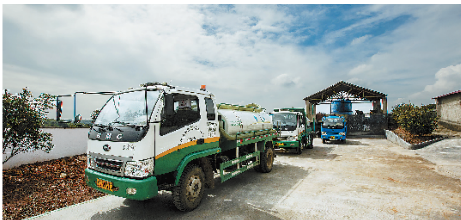
兰溪城西沼液抽排运输服务站,沼液车将养殖场的沼液运到种植基地。

养殖场的沼液去哪儿,是农业水环境整治的难题之一,而沼液利用的核心是养猪场与种植主体对接。今天,在兰溪市的“农民