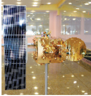
这是9月15日在位于班加罗尔的印度外太空研究组织指挥中心拍摄的火星探测器模型。印度外太空研究组织9月24日宣布,印度首个火星探测器“曼加里安”号当日上午成功进入火星轨道。“曼加里安”号探测器目前正在离火星表面大约500公里处正常运行,距离地球2.15亿公里。