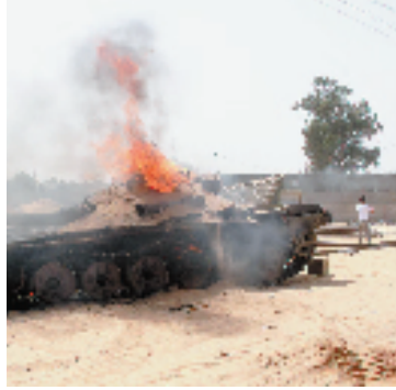
9月23日,在利比亚首都的黎波里沃什法纳区,一辆“利比亚黎明”武装的坦克中弹起火。当日,利比亚支持宗教势力的民兵武装“利比亚黎明”与支持世俗势力的民兵武装在的黎波里市郊的沃什法纳区激战。今年5月以来,利比亚支持宗教、世俗势力的两派民兵武装在的黎波里、班加西等多地激战,冲突已蔓延至盖尔扬、扎维耶等城市。