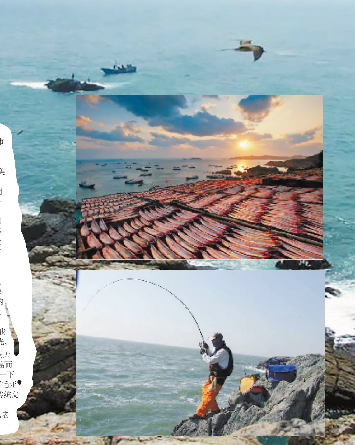
静谧的白沙岛。

我们约定,上岛的48小时里,老家会通过微信公众号(zjrbmlxc)向实验队员的亲友团和全体老家粉播报活动情况,敬请关注。