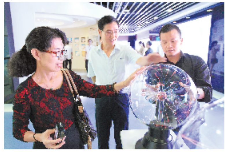
湖州电力教育博物馆近日在国家电网湖州培训基地开馆，展出煤油灯、留声机、新世纪发电机组模型等近千件，从一个侧面反映了湖州经济社会发展的过程。

《中国佛教石经》是中国美术学院视觉中国研究院的重点出版项目，全套16册，预计2020年完成，并同步在德国发行。