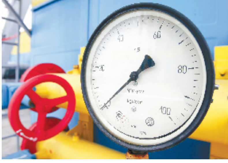
图为在距离乌克兰首都基辅约120公里处拍摄的地下储气设备的压力表。

此次签署的联系国协定与乌克兰联系国协定曾一度成为乌克兰危机的导火索。去年11月底,时任乌克兰总统亚努科维奇在欧盟东部伙伴关系峰会的最后关头,宣布暂停与欧盟签署联系国协定,引发国内大规模抗议示威浪潮,揭开了乌克兰危机的序幕。