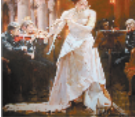
胡振宇《教堂音乐会》