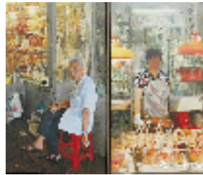
李智华《老广东,小生活》