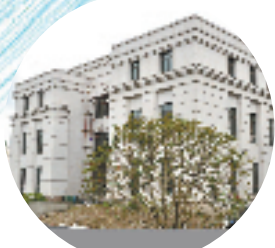
全山石艺术中心教学楼