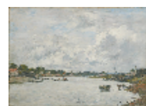
(法)欧仁·布丹《图克河畔》