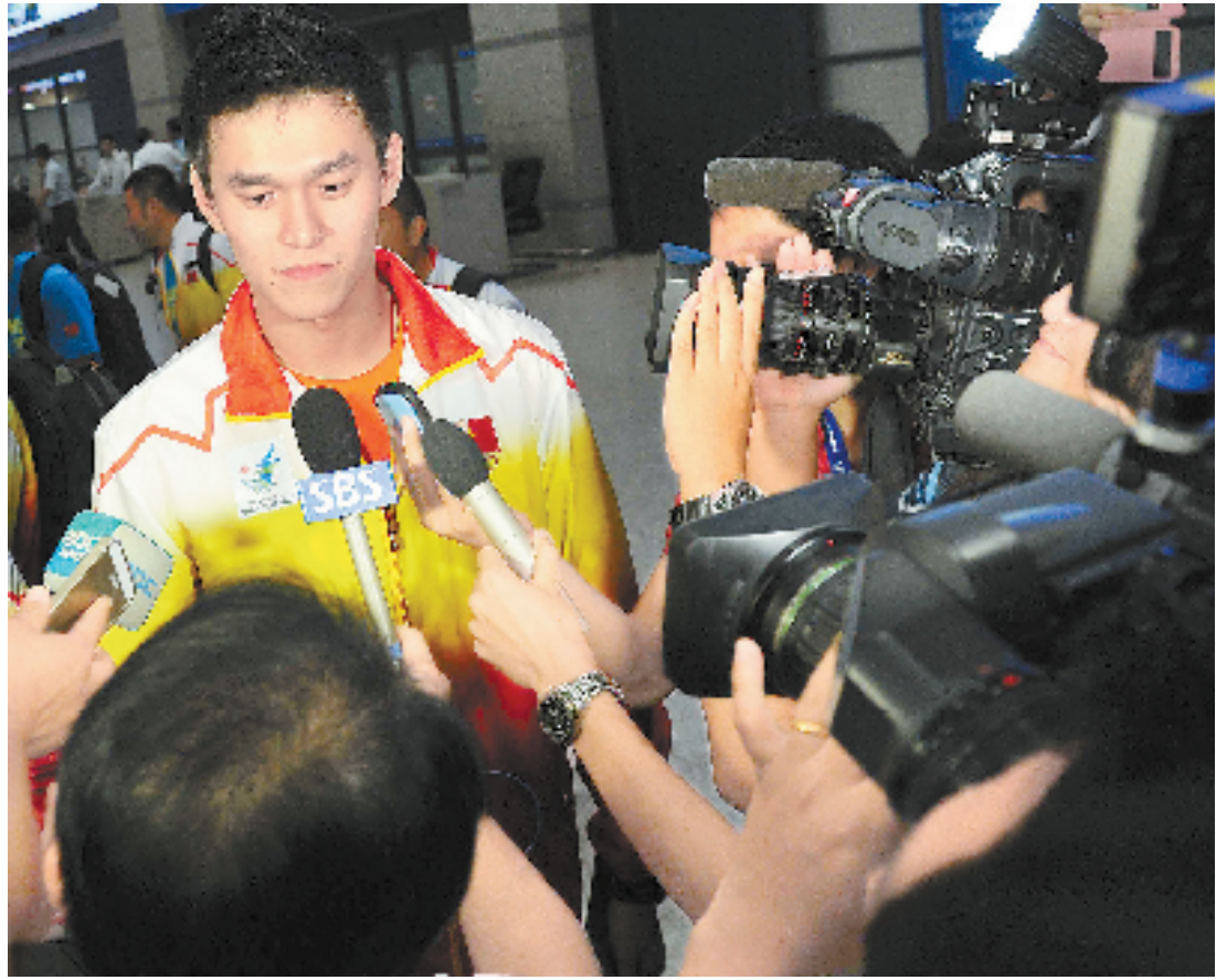
9月16日,中国游泳运动员孙杨走出机场后接受采访。

亚运会游泳比赛将于9月21日开赛,共有38个比赛项目,首日进行6个项目,孙杨与朴泰桓的200米自由泳是第一个决赛。此外还有女子400米自由泳、男子100米仰泳、女子100米蛙泳、男子200米蝶泳和女子4x100米自由泳接力。