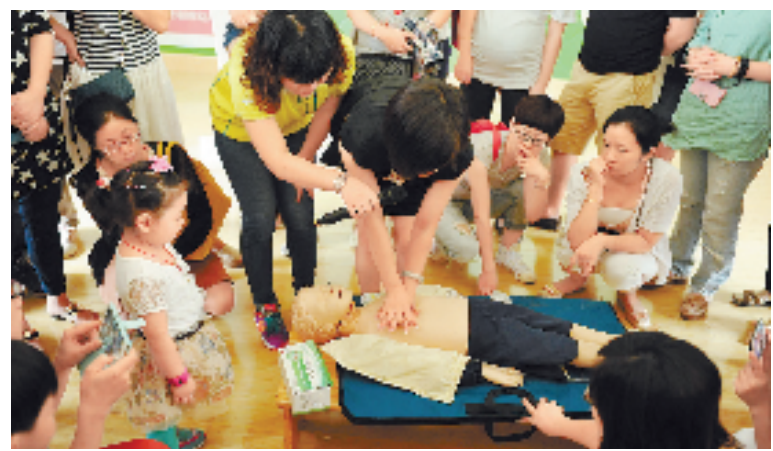
由省疾控中心、浙江在线等举办的“萌宝健康课”开进杭州朝晖幼儿园,为孩子和家长提供疫苗知识和儿童日常保健知识。

在一个缺少蔡元培、竺可桢、经亨颐等大师的年代,其实很多人早已习惯“外行领导内行”,对教育所经历的“说起来重要、做起来次要、忙起来不要”的遭遇也见怪不怪。而秦德亮式的提拔显然将这种轻视进一步“污名化”了。将秦德亮推到前台成为靶子,公众无非是想抨击当前种种量化或无视教育的行径,无论它们有意还是无意。剔除那些非理性的声音,我们也看到了国人一以贯之的教育情怀和执着的教育梦,它们应该被珍视。