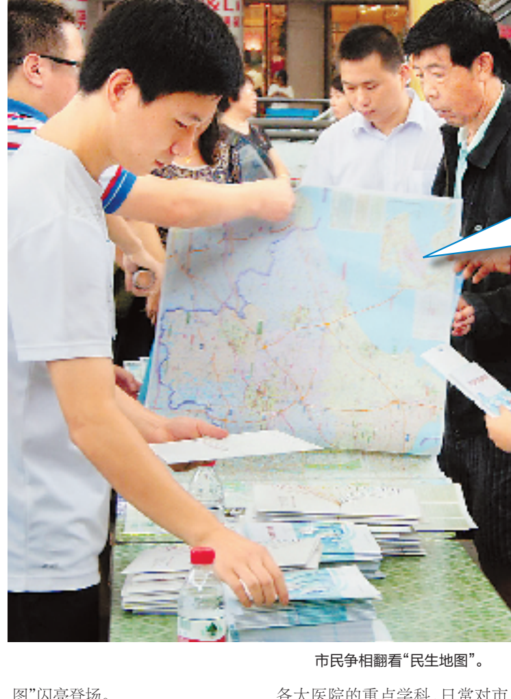
市民争相翻看“民生地图”。