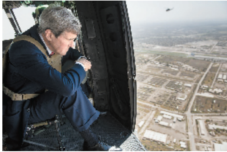
9月10日,美国国务卿克里搭乘一架直升机时俯瞰伊拉克首都巴格达。