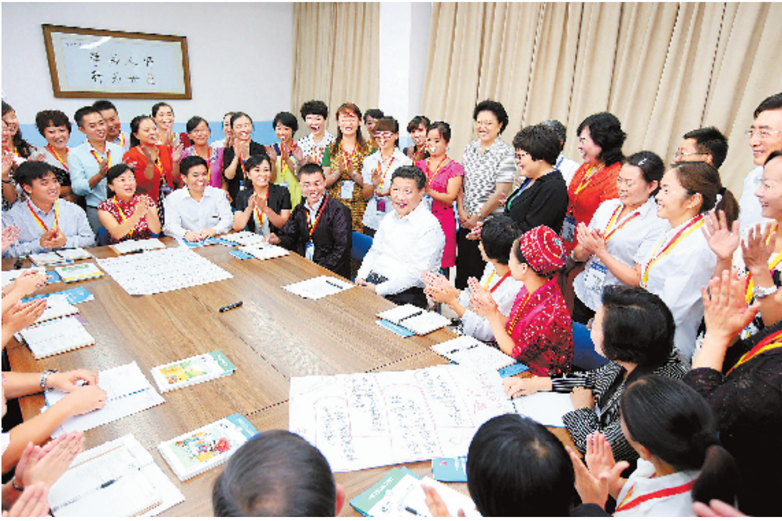
9月9日，中共中央总书记、国家主席、中央军委主席习近平来到北京师范大学看望教师学生，向全国广大教师和教育工作者致以崇高的节日敬礼和祝贺。这是习近平同正在北师大参加“中小学教师国家级培训计划”的贵州小学语文教师交流。