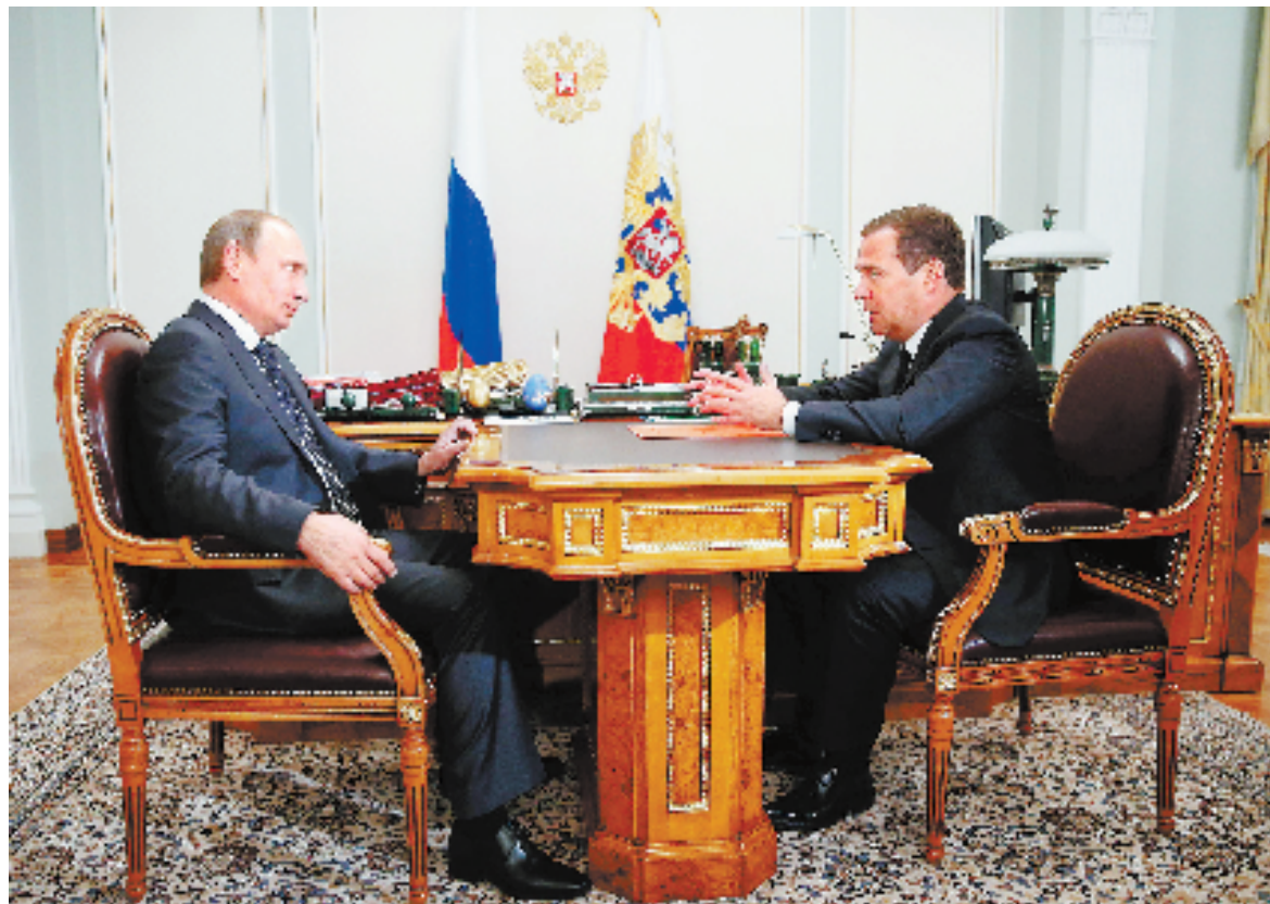
9月8日，在俄罗斯莫斯科科新加廖沃官邸，俄罗斯总理梅德韦杰夫(右)与俄罗斯总统普京商谈。

欧盟委员会主席巴罗佐、欧洲理事会主席范龙佩5日发布联合公报，称欧盟对俄新制裁方案已获欧盟成员国常驻代表同意，欧盟拟于8日以书面程序正式实施该方案。新制裁措施涉及资本市场、防务、军民两用产品和敏感技术。