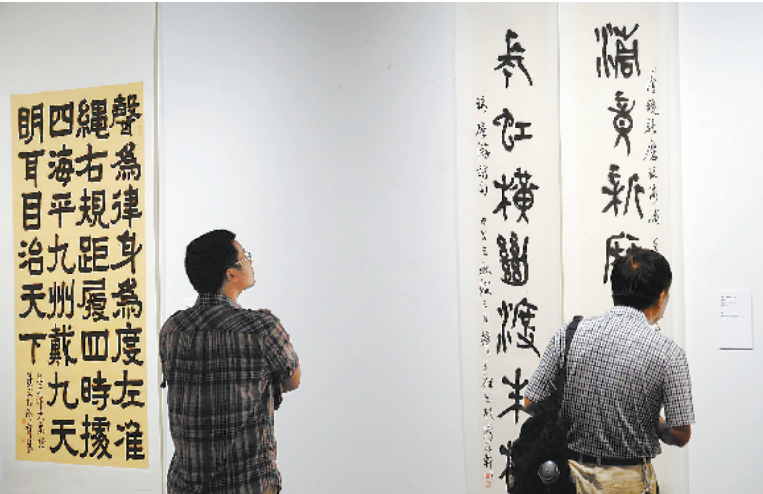
9月4日,“碧水·流觞——五水共治书法邀请展”在浙江美术馆举行。展览邀请了省内百余位书画名家,以中国历史上“治水”为主题的诗文名篇和名言警句为内容,创作了近120幅书法佳作。