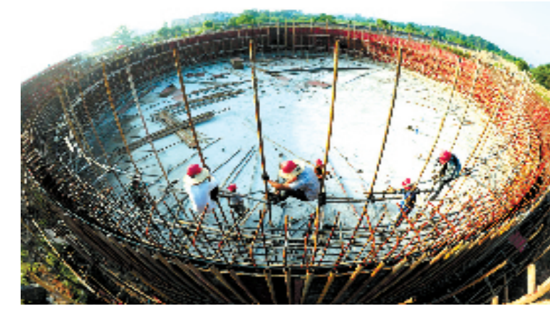
施工人员在武义污水处理二期工程施工现场搭架