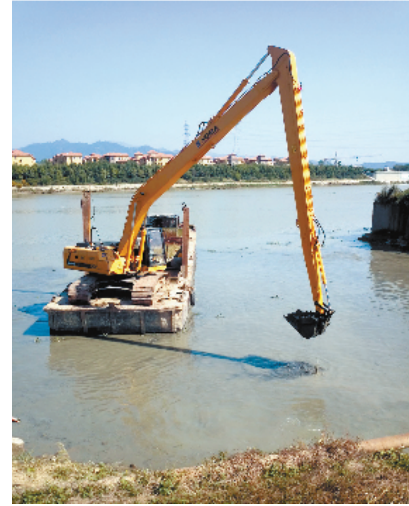
兰江街道清淤整治现场

“浦阳江可以游泳了!”“兰江可以游泳了!”……这个夏天,一个个可游泳的喜讯从八婺大地四面八方传来。金华“五水共治”取得了初步胜利。1-7月,全市流域交界断面考核为良好;20个县市交接断面中,达到或优于Ⅲ类的断面13个占65%,总体水质明显改善,全市8个集中式饮用水源地水质均达到Ⅱ类,达标率100%。