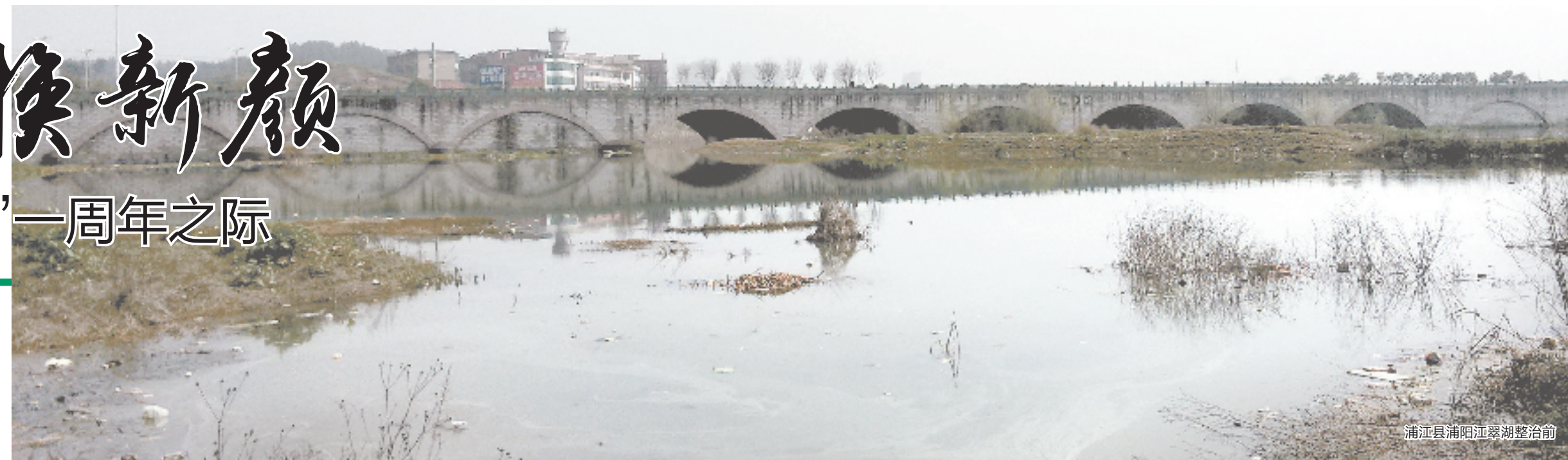
浦江县浦阳江整治前

一个全面覆盖乡镇的治水领导机构,也是金华率先构建的。金华市委、市政府成立领导小组,书记、市长亲自挂帅当组长,下设办公室,由市委副书记担任主任。办公室抽