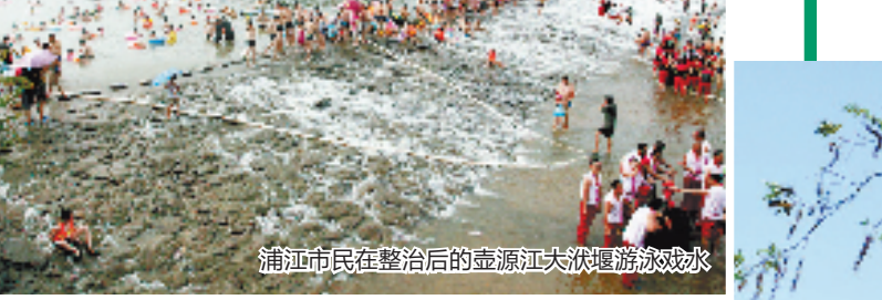
浦江县市民在整治后的壶源江头休闲游玩戏水

按照“问题到点,时间到周”的要求,金华建立“单元化作战,包点式治水”的“3+3”护水作战模式,建立全方位、全天候的督查暗访机制。市委、市政府主要领