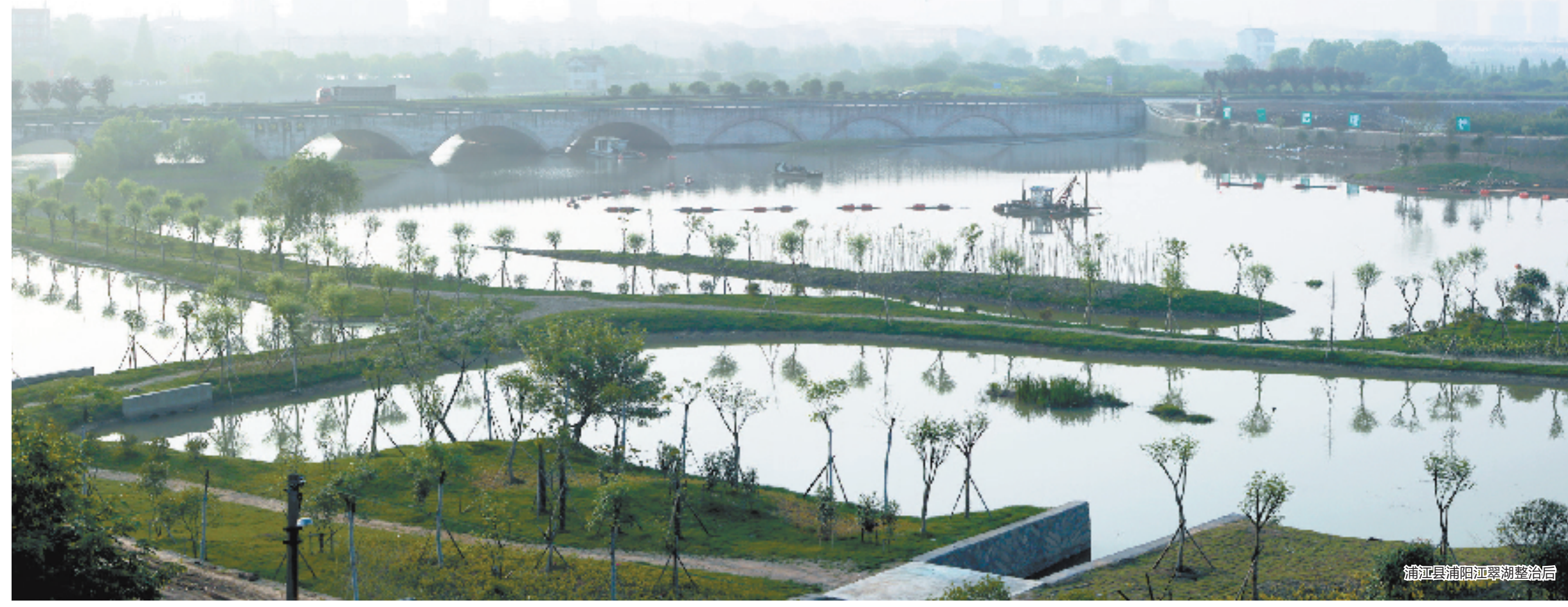
浦江县浦阳江整治后