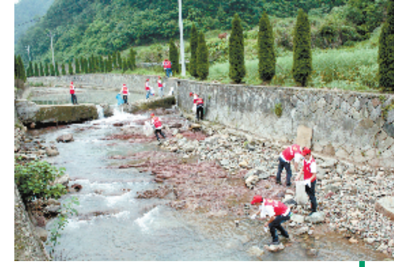
浦阳江上游河道清理

随着“五水共治”工作的推进,罗埠溪已清澈如许,从空中俯拍,仿佛一条“绿带”傍镇而过。此前该溪是“最差一条河”之一。