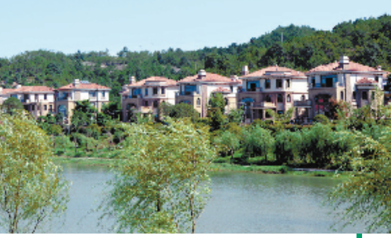
整治后的永康市“最美河流”李溪风景区