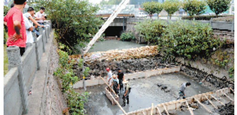
东阳东溪溪沟改造工程施工现场施工人员正在施工中

按照全方位、全水系、全流域、全覆盖的要求,金华在“五水共治”中,坚持从最难处着手、最硬的骨头先啃,大力开展“清浩河道美丽家园”、“治砂清水”、“灭黑臭”狙击战等专项行动,基本完成砂场整治,取缔违法砂石场633家,拆除516家;完成黑臭河整治729.2公里,清理河道6289公里,清除水城垃圾50多万吨,在全省率先消灭垃圾河,实现水系无漂浮物、河道无障碍物、河岸无垃圾。