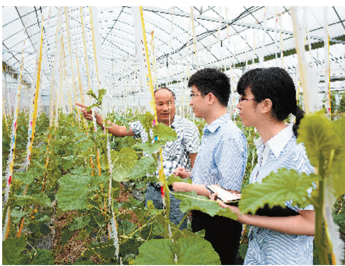
上虞农合行客户经理正在走访指导西瓜种植基地。

推进信用工程基础上,省农信联社引导推广丰收小额贷款卡和丰收创业卡,作为发放信用贷款的载体,分别面向30万元以下农户贷款和30万元至100万元小微企业贷款。“现在我们农民小额贷款,就和从自己卡取钱一样方便。”近日,养猪大户,富