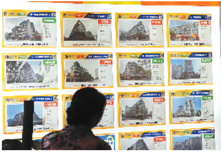
一位客人正在看房屋买卖信息。